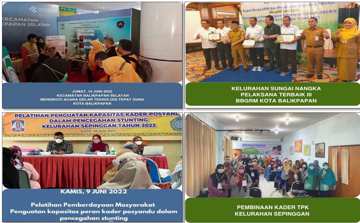
Gambar 3. 2 Program Pemberdayaan Masyarakat Desa dan Kelurahan

Program Pemberdayaan Masyarakat Desa dan Kelurahan ini pun di evaluasi melalui Perhitungan Persentase Partisipasi Masyarakat berdasarkan Data yang telah dikumpulkan oleh masing – masing Kelurahan dan Kecamatan Balikpapan Selatan sebagai dasar yang kemudian di bagi dengan Jumlah Penduduk Usia Produktif (15 – 64 Tahun), sehingga data yang didapat sebagai berikut :