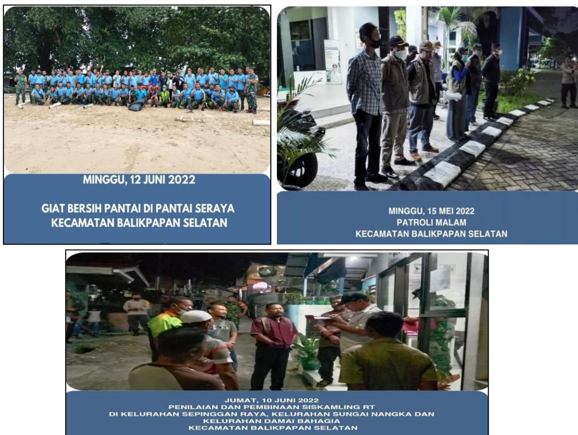
Gambar 3. 3 Program Koordinasi dan Ketertiban Umum

Balikpapan Selatan, dimana dalam kegiatan ini, seluruh unsur masyarakat pun turut terlibat baik dari Rukun Tetangga(RT) maupun Perlindungan Masyarakat (Linmas) yang ada di setiap Kelurahan se Kecamatan Balikpapan Selatan.