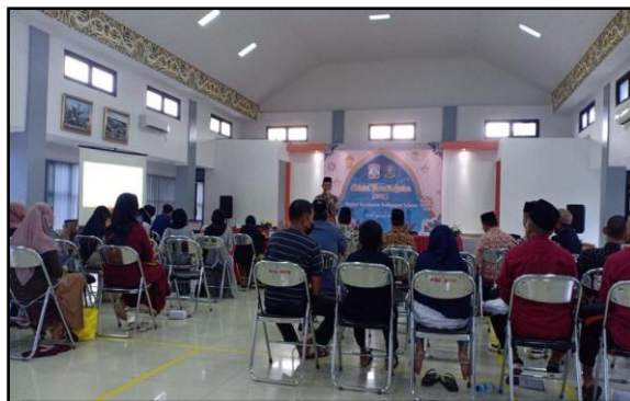
KEGIATAN SELEKSI TILAWATIL QUR'AN