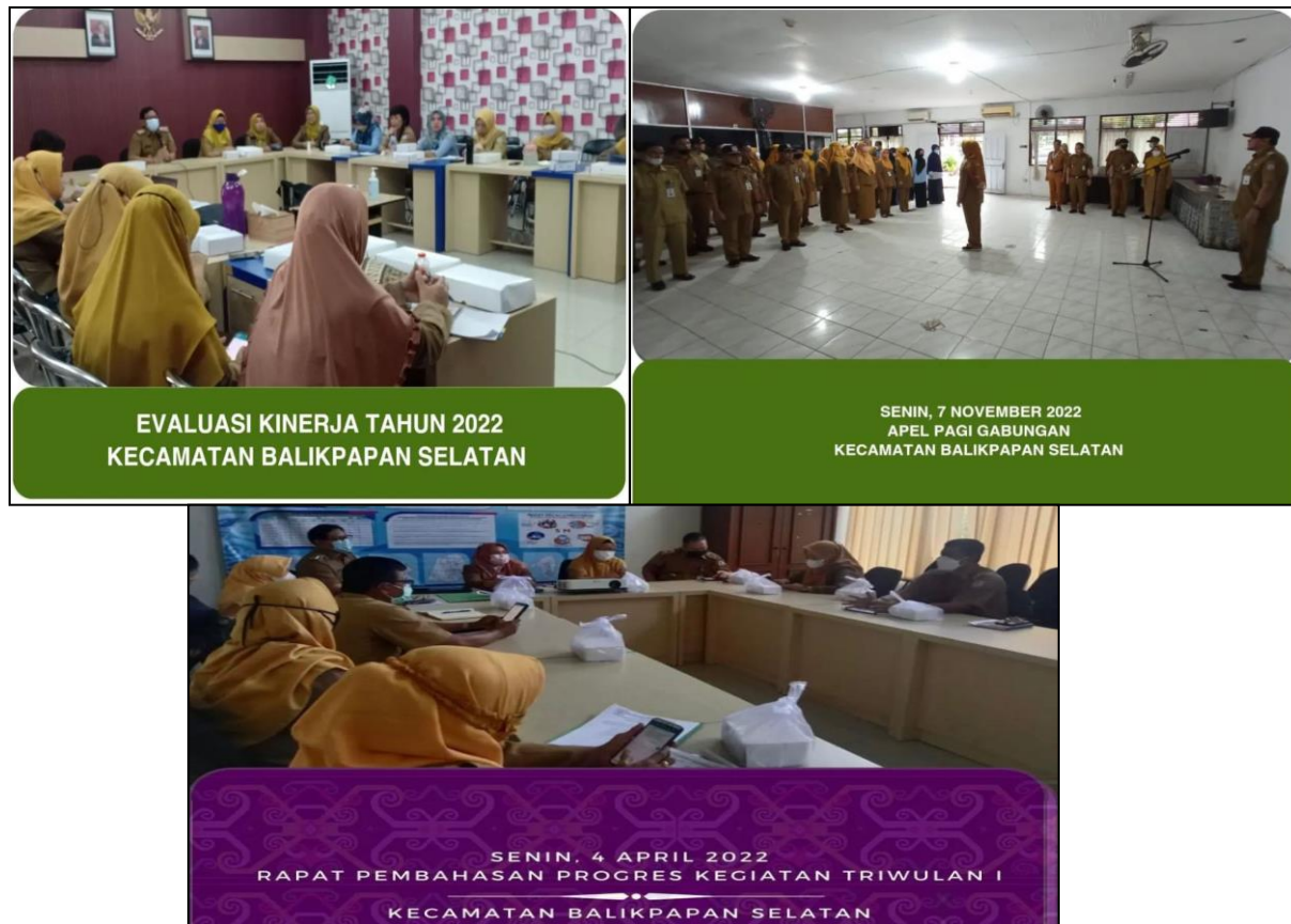
Gambar 3. 4 Program Penunjang Urusan Pemerintahan Daerah Kabupaten/Kota

Survey Kepuasan Internal Kecamatan Balikpapan Selatan dilakukan sekali dalam setahun untuk mengukur Keberhasilan indikator Penunjang dalam mencapai Sasaran Strategis Kecamatan Balikpapan Selatan, adapun hal – hal yang menjadi indikator pertanyaan yaitu :