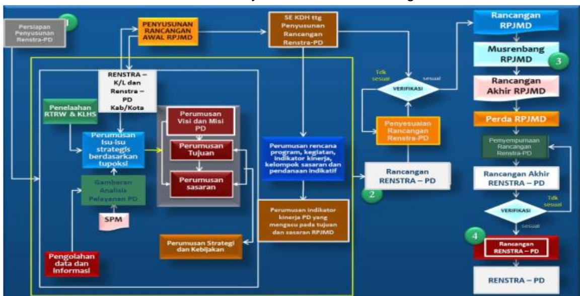
Gambar 1.1. Alur dan Tata Cara Penyusunan Renstra Perangkat Daerah